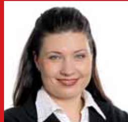
Marina Rebeka – Lettland, Sopran *1980