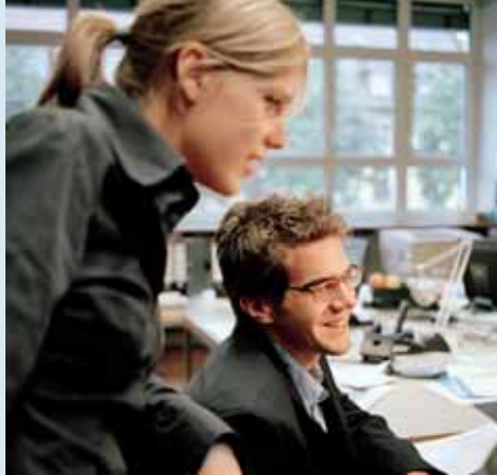
Eine Untersuchung der Bertelsmann Stiftung zeigt, dass Jugendliche in Deutschland ein positives Unternehmerbild haben.