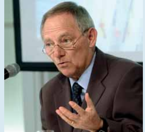
Innenminister Dr. Wolfgang Schäuble eröffnete die EPSA-Auftaktveranstaltung in Berlin.