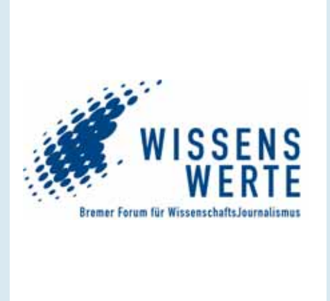
In Zusammenarbeit mit dem Deutschen Journalisten-Verband (DJV) veranstaltete die Bertelsmann Stiftung das Bremer Forum „Wissenswert“.