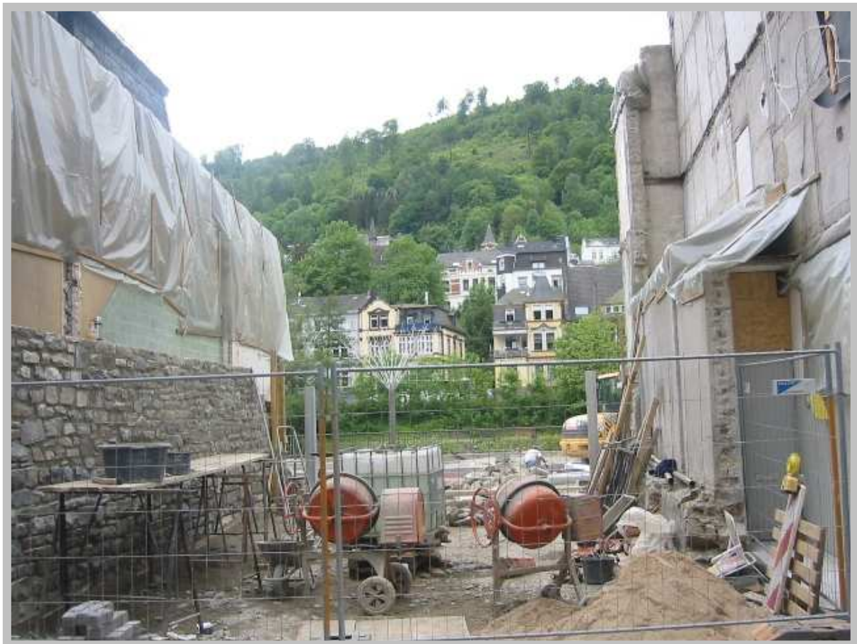
A. Bock - 3. Platz im Fotowettbewerb „Wie erlebe ich den Stadtbau“