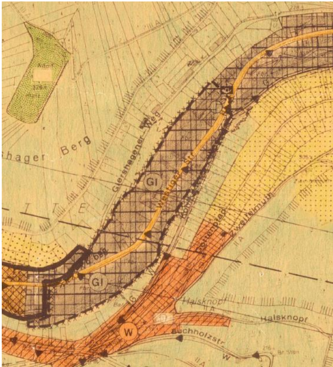
Abbildung 2: Ausschnitt aus dem Flächennutzungsplan im Bereich Nettestraße - ohne Maßstab